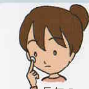
長年のハードコンタクト着用