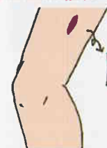
①太ももの外側から筋膜を採取する