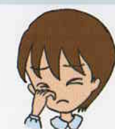
頻りに目をこする