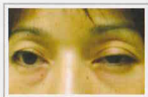
後天性眼瞼下垂症