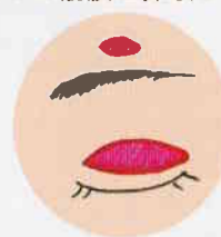
②皮下トンネルを作る