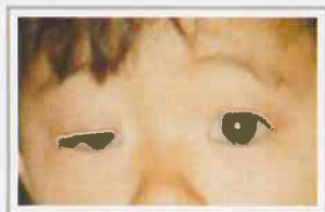
先天性眼瞼下垂症