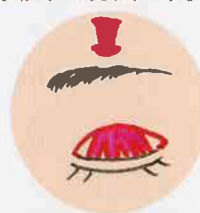
③採取した筋膜をさいて入れる